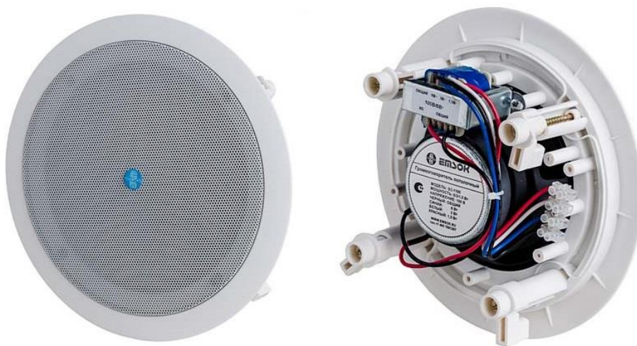
Рис. 1. Внешний вид громкоговорителя.

Внешний вид громкоговорителя показан на рис. 1.